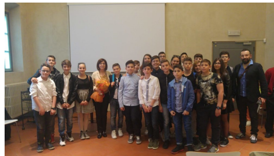
Le foto della premiazione della quinta edizione del concorso